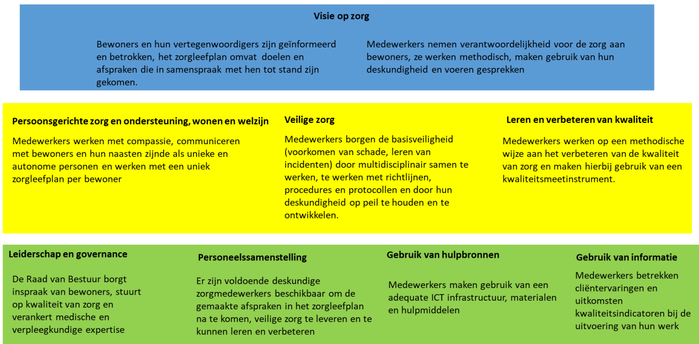
Figuur 1 voornemens 2021